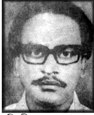
শিল্পী আলতাফ মাহমুদ

১৯৫৬ সালে শিল্পী আলতাফ মাহমুদ বাবার অনুমতি নিয়ে একটি বিদেশী চার্চ সঙ্গীতের সুরের অনুকরণে গানটি পুনরায় সুর করেন যেটি আমরা এখন শুনতে পাই। এ সুরটিই বাংলাদেশে এখন গীত হয়ে আসছে এবং বিপুল জনপ্রিয়তা লাভ করেছে। ১৯৭১ সালে হানাদার পাকিস্তানী বাহিনীর নির্মম অত্যাচারে মৃত্যুবরণ করেন শিল্পী আলতাফ মাহমুদ।