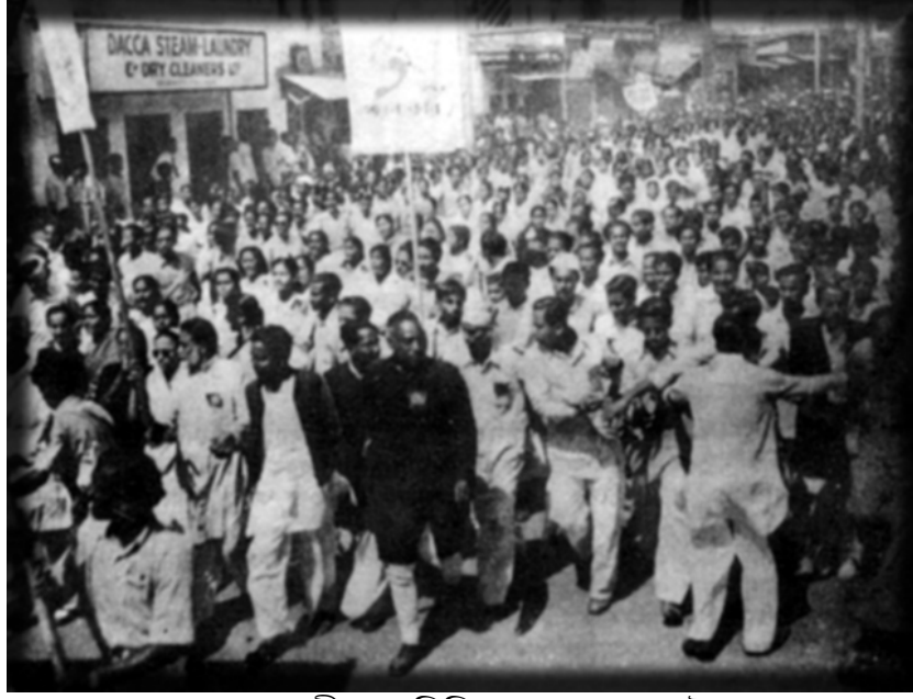
১৯৫২র ২২শে ফেব্রুয়ারীর গনমিছিল, সামনে আতাউর রহমান খান

১৯৪৩ এ দুর্ভিক্ষ-র ওপরে জয়নুল আবেদীনের আঁকা ছবি আজো আমাদেরকে হতবাক করে, বিজন ভট্টচার্য রচিত ‘নবান্ন’ গীতি-নাট্য একটি অসাধারণ মাইল ফলক। ১৯৪৬ এ তে-ভাগা আন্দোলনের ওপর রচিত গান ‘হে সামালো ধান হো, কাণ্টেটা দাও শান হো - আজো আমাদের যে কোন আন্দোলনের সময় প্রেরণা দেয়। বঙ্গভঙ্গ আন্দোলনে রবীন্দ্রনাথ ঠাকুরের গান, ক্ষুদিরামের ফাঁসির গান, গান্ধীজির সত্যগ্রহের সমর্থনে ডি এল রায় এর গান, আমাদের ৬৯-এর গন-আন্দোলন ও ৭১ এর স্বাধীনতা সংগ্রামে বাংলাদেশ ও ভারতের গীতিকার, সুরকার আর কণ্ঠশিল্পীদের রচিত ও পরিবেশিত অসংখ্য গান ও কবিতা আজো অমর হয়ে আছে, যতদিন পৃথিবীতে বাঙালি বেঁচে থাকবে - এসব গান-কবিতা তাদের পথ দেখাবে। এসব গান-কবিতা আমাদের বাঙালিদের দৈনন্দিন দিনযাপনের অঙ্গ হয়ে দাড়িয়েছে।