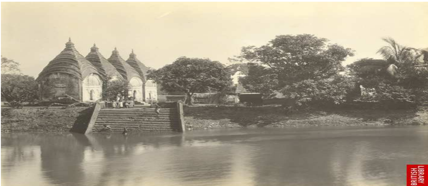
Dhakeshwari Mandir – 1904