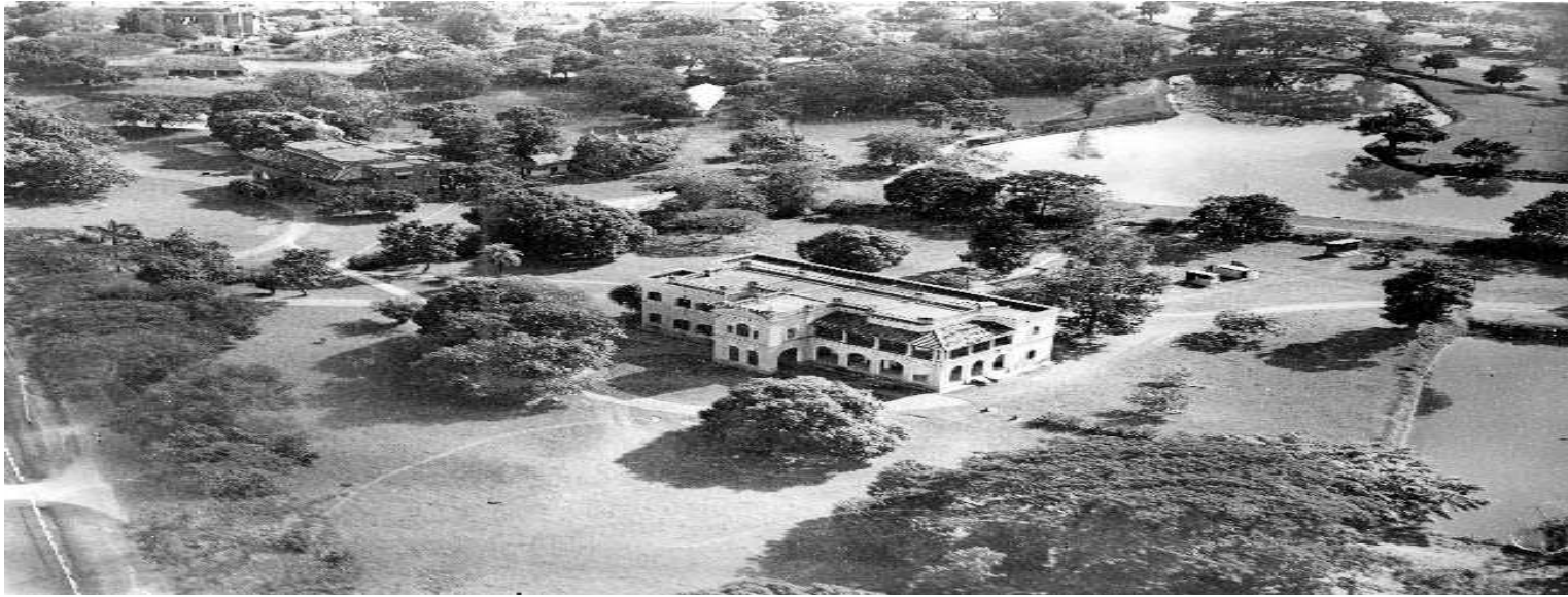
A British Officer's Mess in Dhaka – 1934 (Picture taken from a Wireless Tower)