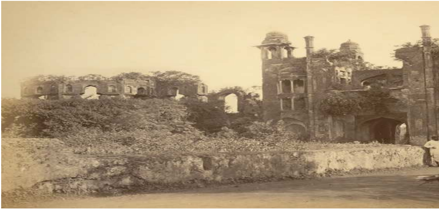
Laalbag Kella – 1872