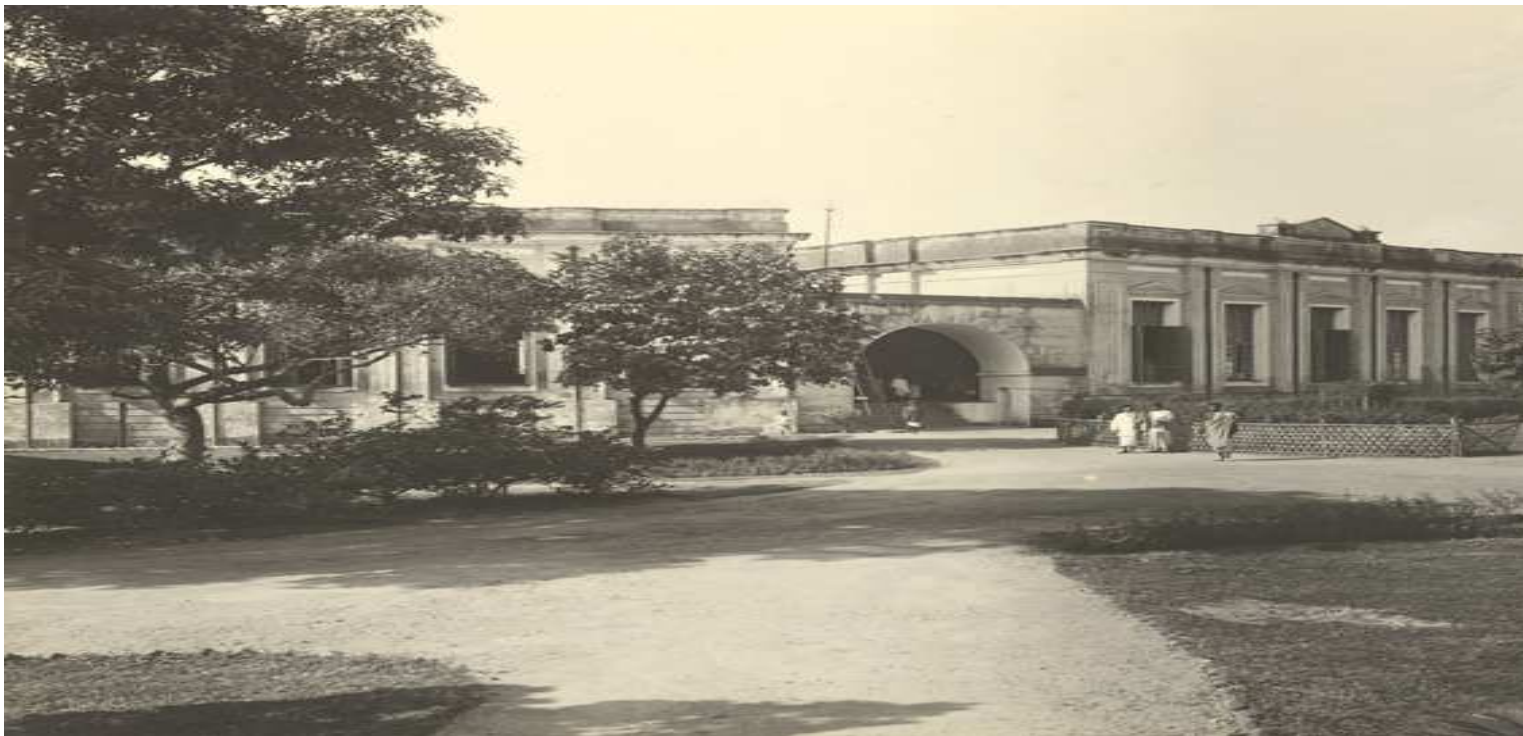
Mit Ford Hospital – 1904 ( Where Present Salimullah Medical College )