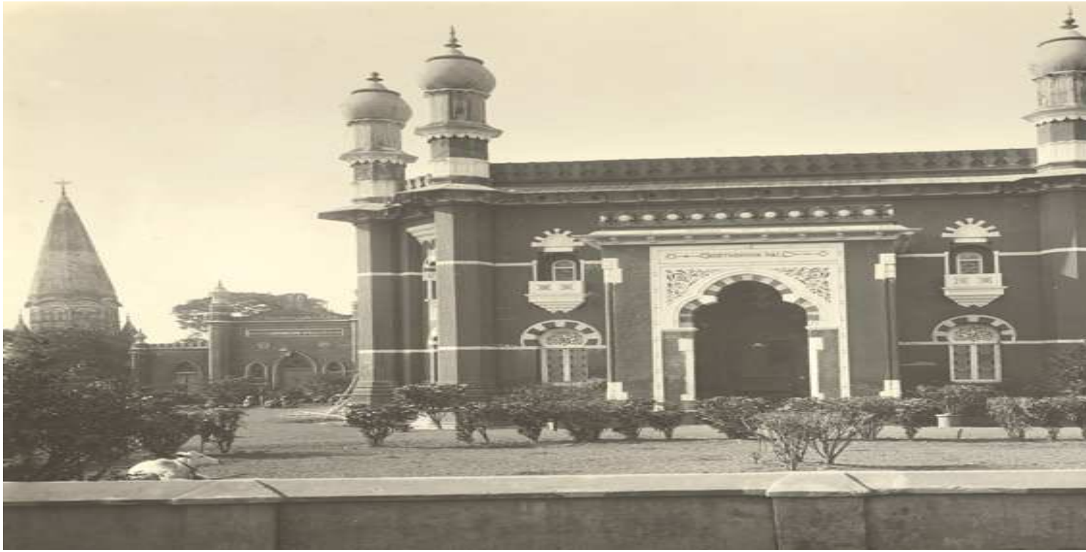
NorthBook Hall – 1904 ( The area we know as NorthBook Hall Road Today)