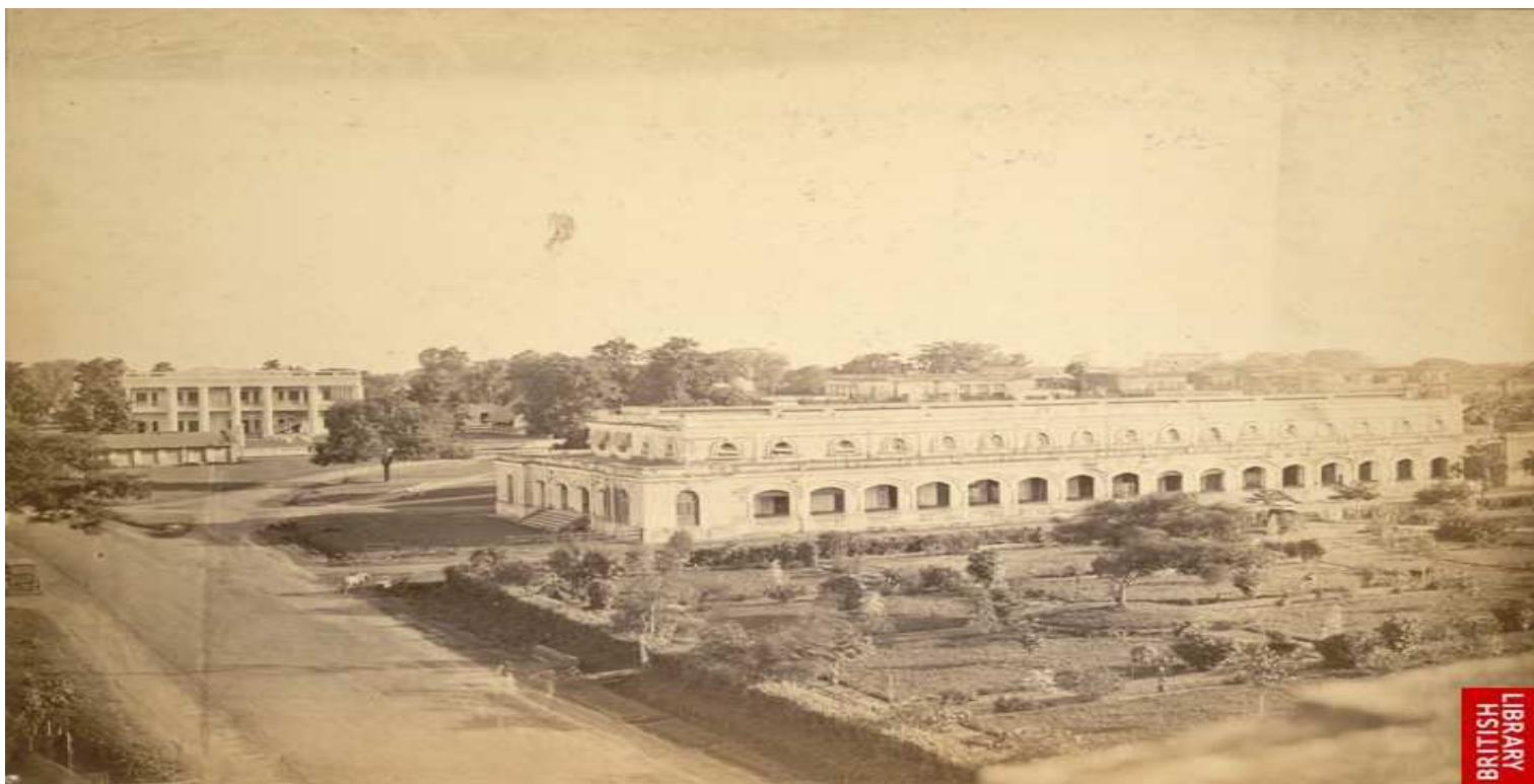
A scene of PURANA PALTAN, Dhaka – 1875