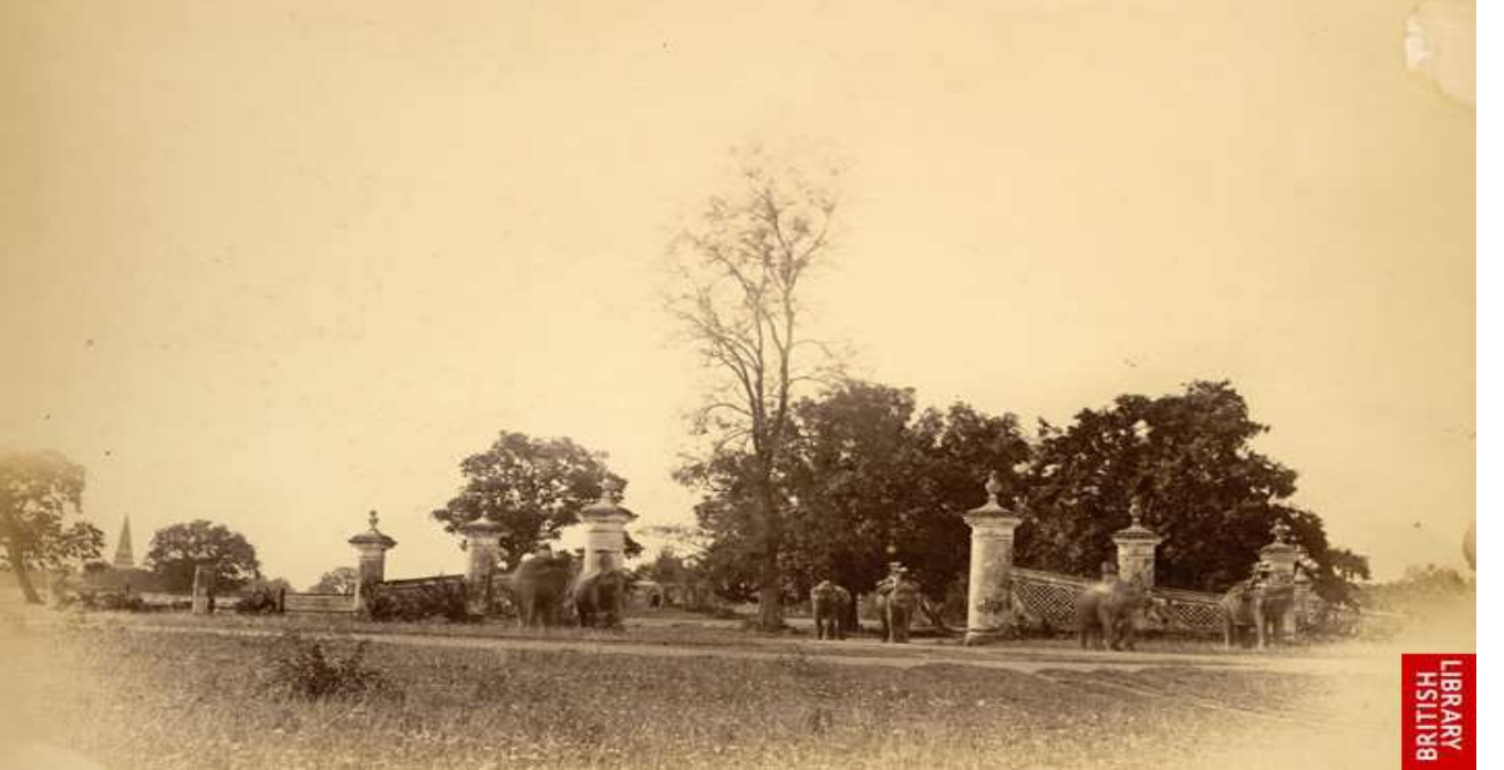
Ramna Gate – 1901 ( Where Present day Doyel Chattar is located)