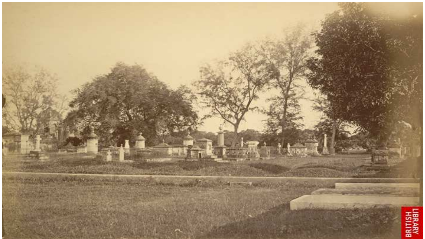
Narinda ( Present Day Old Dhaka ) Christian Grave Yard - 1875