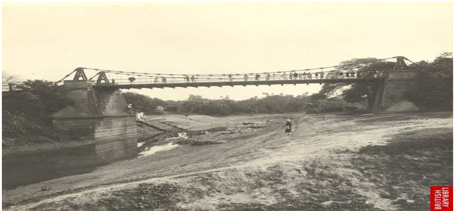
Steel Bridge on Dholai Khal – 1904 (That BUS Conductors call LOHAR POOL today)