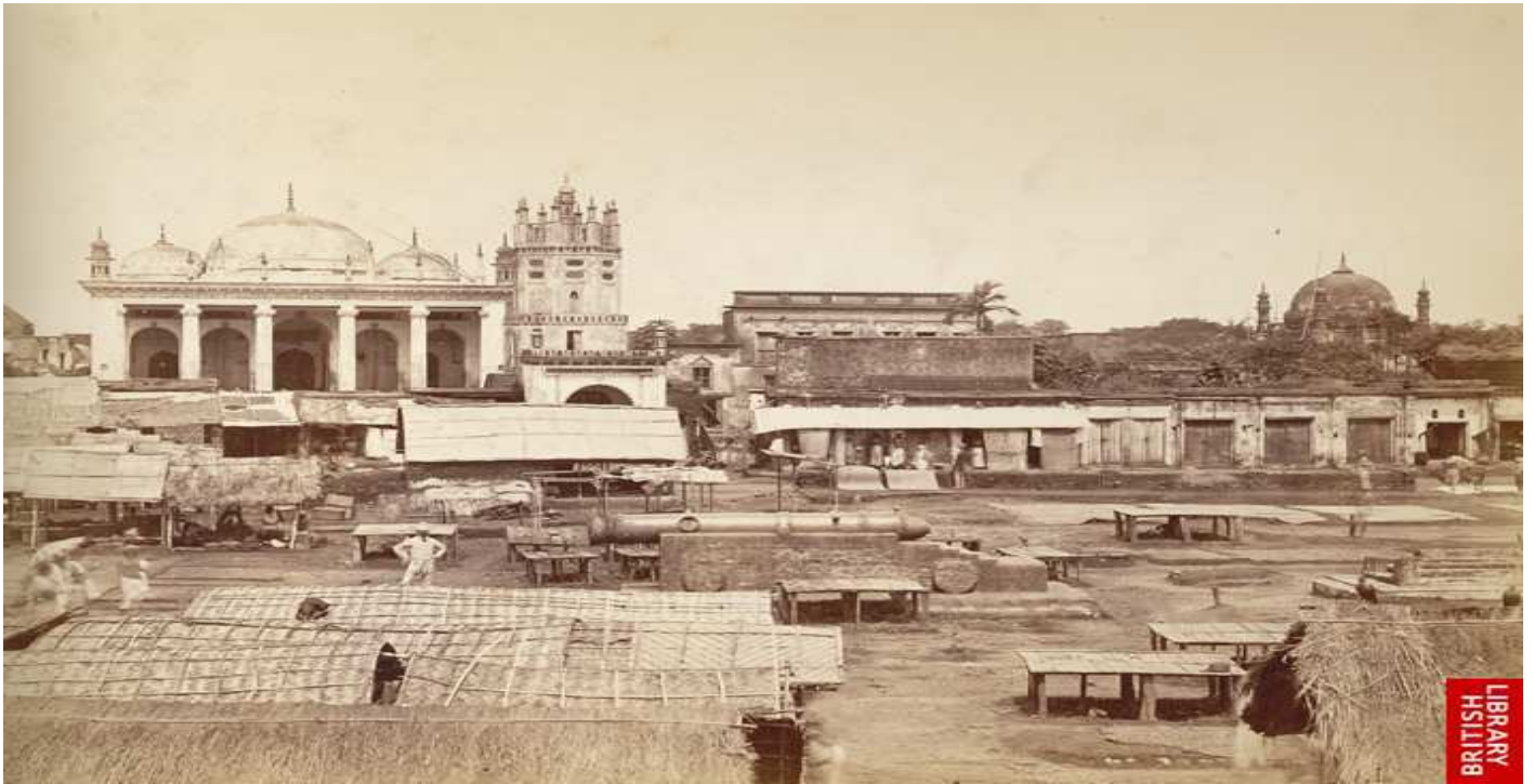
Chowk Bazar, Dhaka – 1885