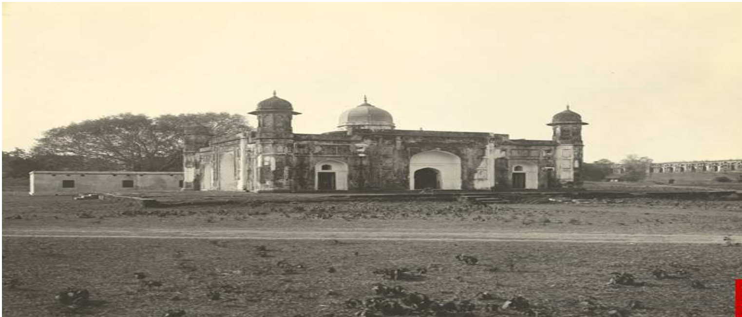
PARI BIBI'R Mazar – 1904 ( inside LaalBag Kella )