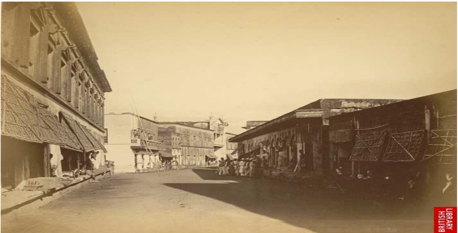
An unidentified street scene of Dhaka – 1872