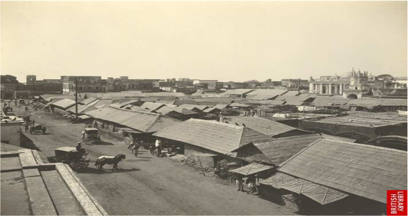
Chowk Bazar mor – 1904 ( Beside this road today’s Sheikh Burhanuddin College Located...We know this road as Nazimuddin Road today)