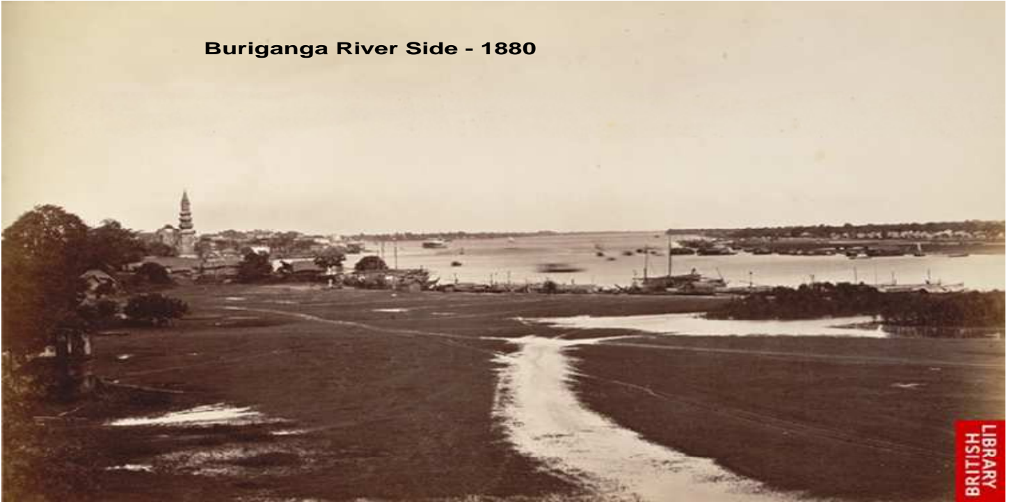
Buriganga River Side - 1880